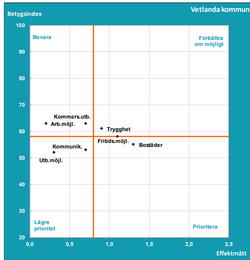
Diagram A1. Nöjd-Region-Index (NRI). Prioriteringsmatris för Vetlanda kommun 2019.

Frågeområden som bör Prioriteras förväntas vid en förbättring ha stor påverkan på helhetsbetyget NRI. Dessa har fått relativt låga betygsindex och har förhållandevis hög effekt, det vill säga stor påverkan på helhetsbetyget NRI.